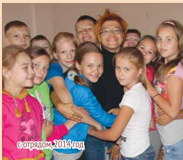
с отрядом, 2014 год

А возможно счастья мне и нет... И его нашел кто-то другой... Но ведь должен быть мне в жизни свет! Или кто-то, кто пойдет со мной...» Я тихонько забралась под плед, И налила в кружку теплый чай... Пусть не будет в моей жизни бед! Только дружба, мир, покой и май :)))