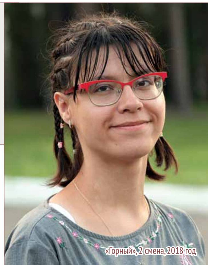
«Горный», 2 смена, 2018 год

Корреспондент журнала «Горный [Ne FoRmat]» с 2014 года. В 2018 году воспитатель пятого отряда.