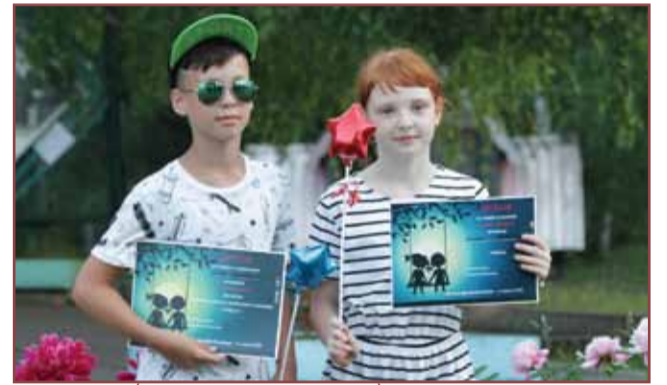
парочка (младшие отряды). страница 4