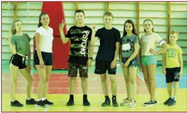
весёлые старты страница 3