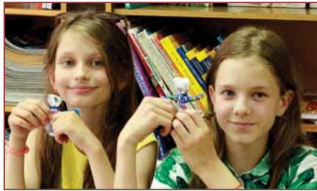
кукол из ткани делаем сами. страница 5